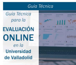
Guía técnica para la evaluación online en la Universidad de Valladolid