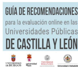
Guía de recomendaciones para la evaluación online