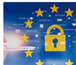
Guía sobre protección de datos en docencia virtual