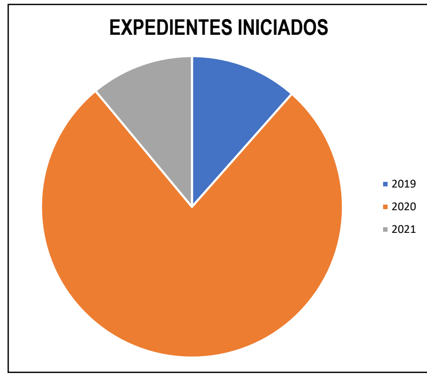
Expedientes iniciados en el registro electrónico UVa (2019-2021)