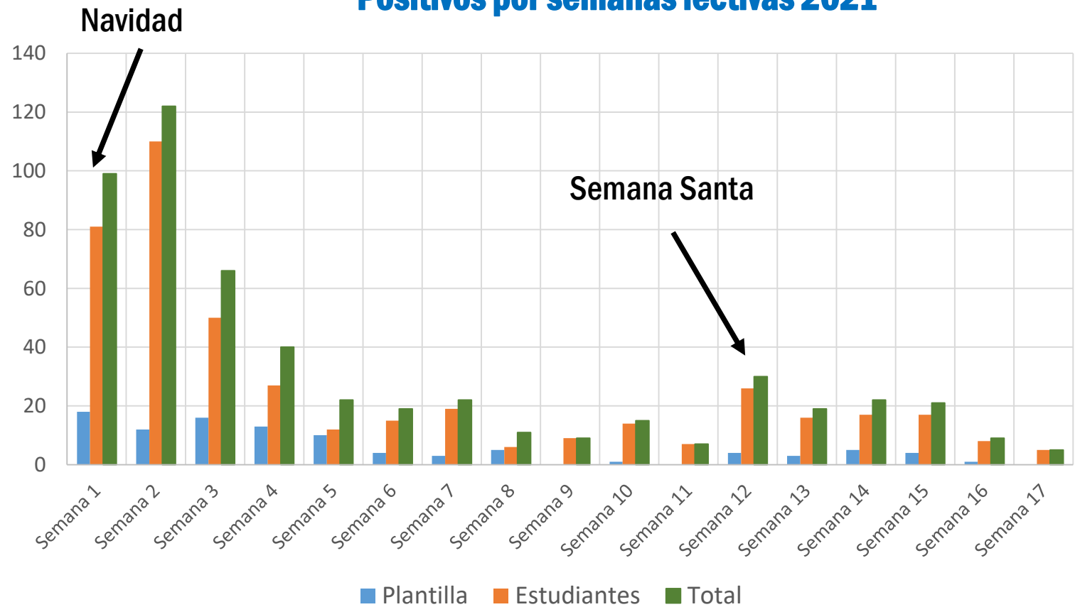
Positivos por semanas lectivas 2021