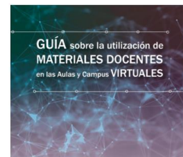
Guía sobre la utilización de materiales docentes en las aulas y campus virtuales